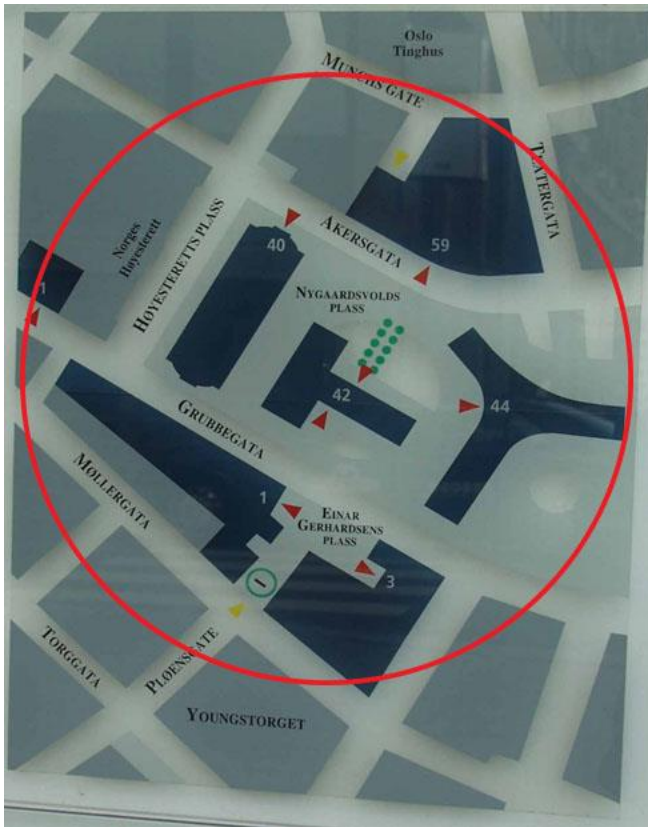
Regjeringkvartalet Kart og flyfoto; NorgeDigitalt/Statsbygg

Det permanente minnesteedet i regjeringkvartalet vil, når det kommer på plass, bli del av et by- eller parkrom og skal inngå i det nye regjeringkvartalets arkitektur. Mange og ulike grupper av besøkende vil høyst sannsynlig benytte seg av det, både de direkte berørte og et generelt publikum. Det vil også sannsynligvis bli et sted for offentlige markeringer og seremonier.