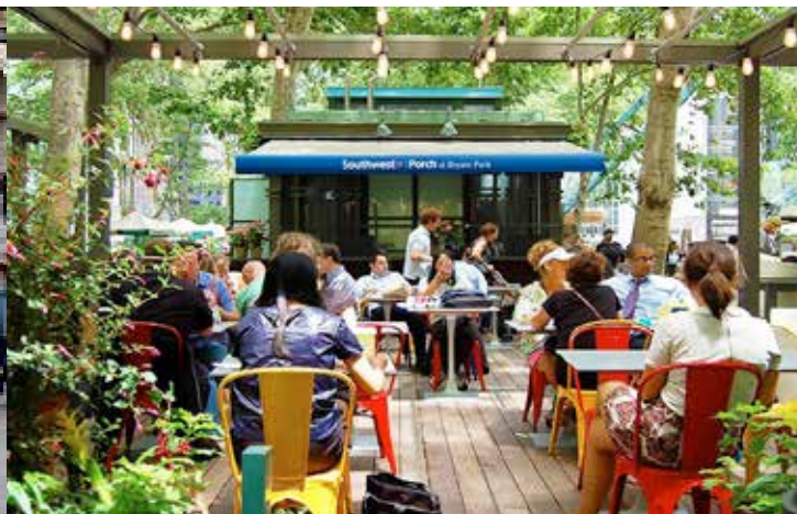
Mer grønt, økt biologisk mangfold