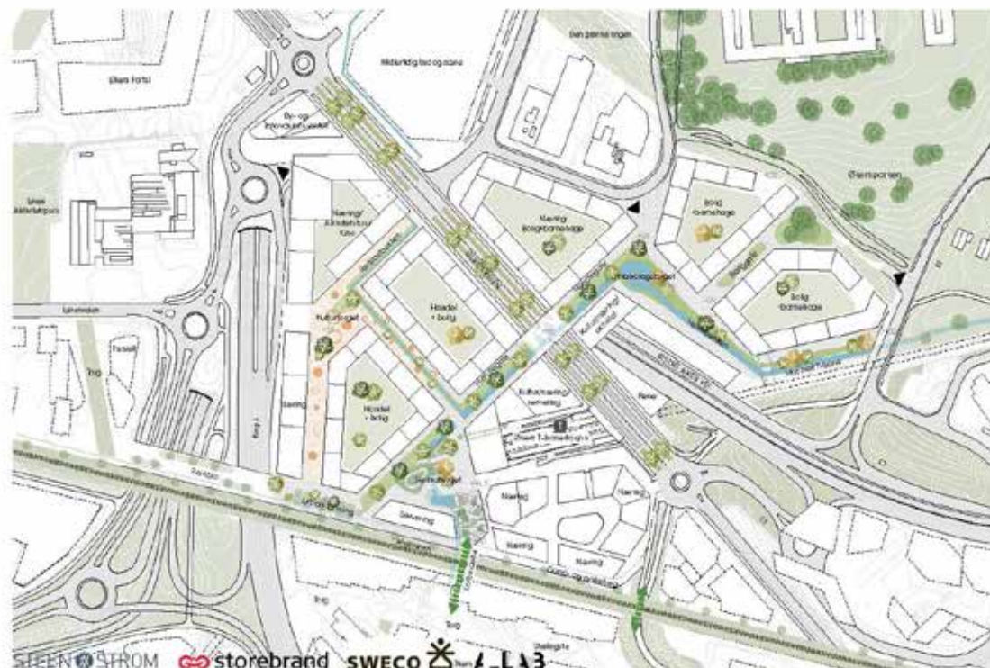
Skisse av framtidig byplangrep (Illustrasjon: A-LAB)

Forslagstiller har startet en omfattende prosess med medvirkning, sosiokulturelle kartlegginger, aktørdialog og stedsaktivering parallelt med planarbeidet. Det er interessant å se hvordan et kunstprosjekt kan knyttes mot de faktiske funnene og behovene for utviklingen av Økern.