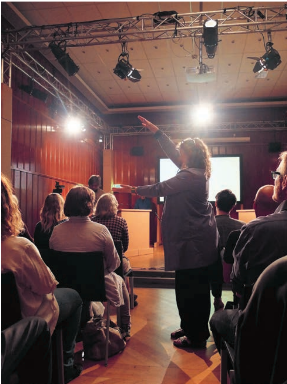
Alle bildene er fra opptakene av Compen , 25. april 2014, Sal G.