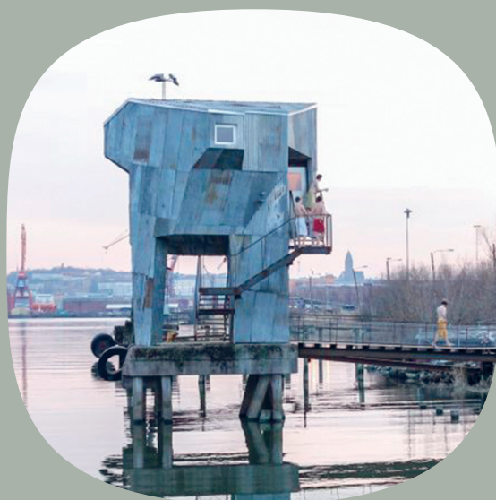
Allmänna Badet, Raumlabor. Frihamnen, Göteborg, 2014.