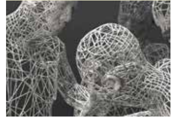
Miao Xiaochun Limitless