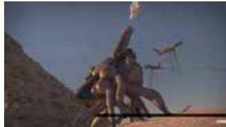
Tian Xiaolei digital animasjon The World , 4 min 40 sek The Poem , 7 min 29 sek Nothingness , 2 min 37 sek