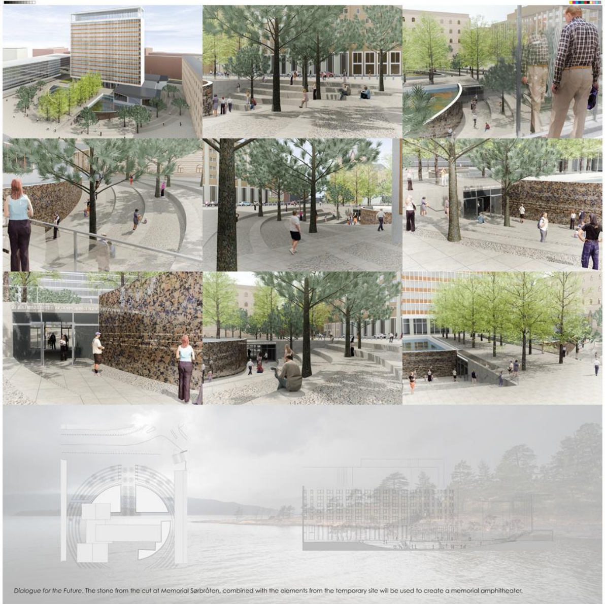
Dialogue for the Future. The stone from the cut at Memorial Sørbrøten, combined with the elements from the temporary site will be used to create a memorial amphitheater.