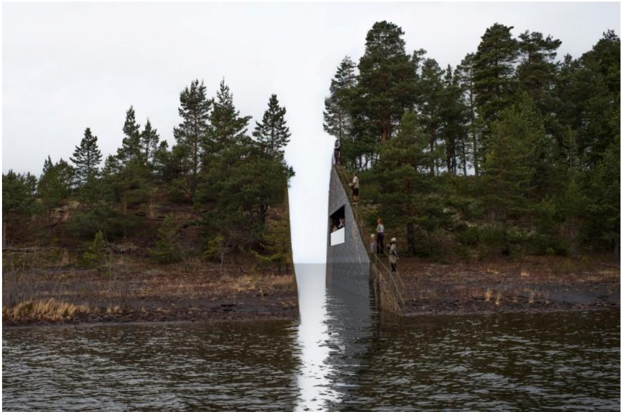
Illustrasjon: Jonas Dahlberg Studio