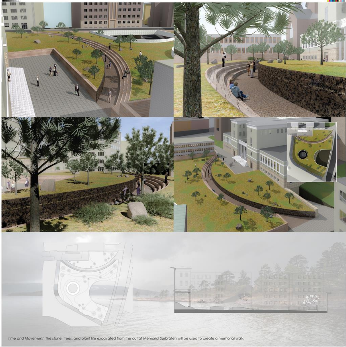
Time and Movement. The stone, trees, and plant life excavated from the cut at Memorial Sarbråten will be used to create a memorial walk.