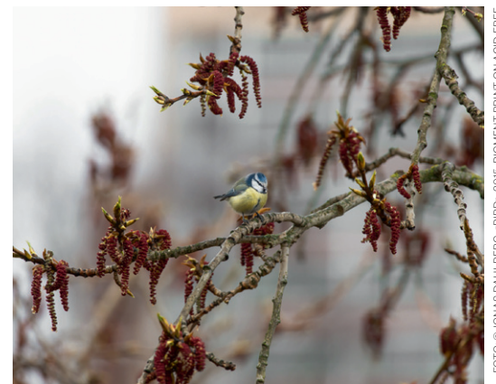
FOTO: © JONAS DAHLBERG, «BIRD», 2016, PIGMENT PRINT ON ACID FREE COTTON RAG

Det hender han er litt misunnelig på dem som vokste opp vel vitende om at det var dette de skulle, sier han: Som hadde foreldre som tok dem med på utstillinger og starter med en naturlig trygghet i