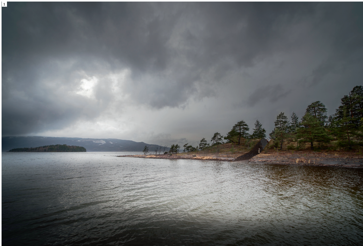
BILDE 1: MINNESSTEDET I 22. JULI PÅ SØRBRÅTEN, ILLUSTRASJON AV JONAS DAHLBERG STUDIO

Fremfor å ta en pause fra arbeidet bestemte han