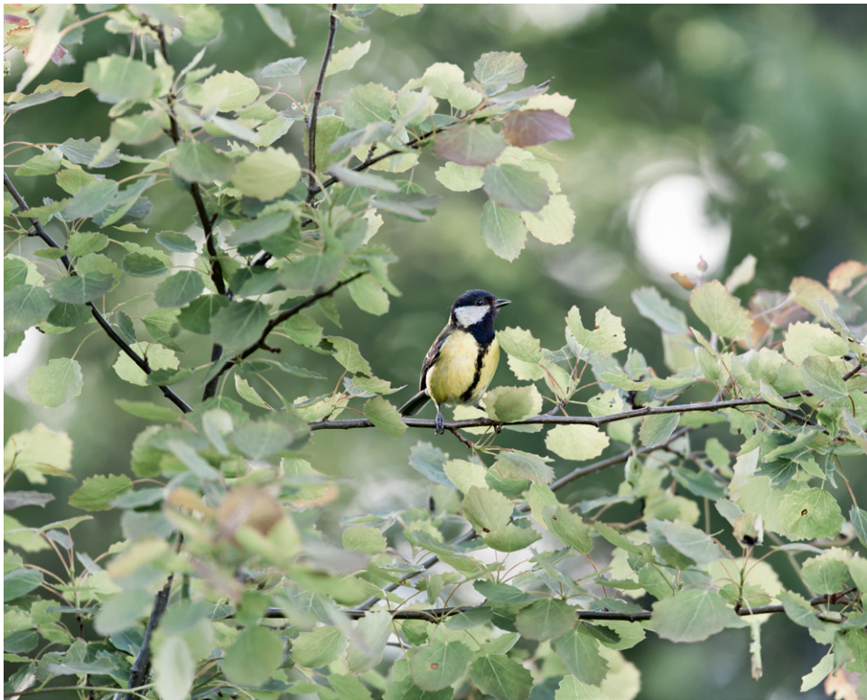
FOTO: © JONAS DAHLBERG, «BIRD», 2016, PIGMENT PRINT ON ACID FREE COTTON RAG

▲ Inn i fuglekassa. Å stille ut nerdete fuglefotografi på et av Nordens beste gallerier, følte potensielt feilaktig og «modig som faen», sier Jonas Dahlberg. «Fuglefoto?» sa galleristen ifølge Dahlberg: «Var det det modigste du kunne gjøre?» – Men kanskje det var det, sier Dahlberg nå. – Kanskje det er det.