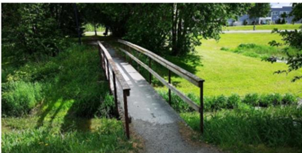
Bru over Kvisla