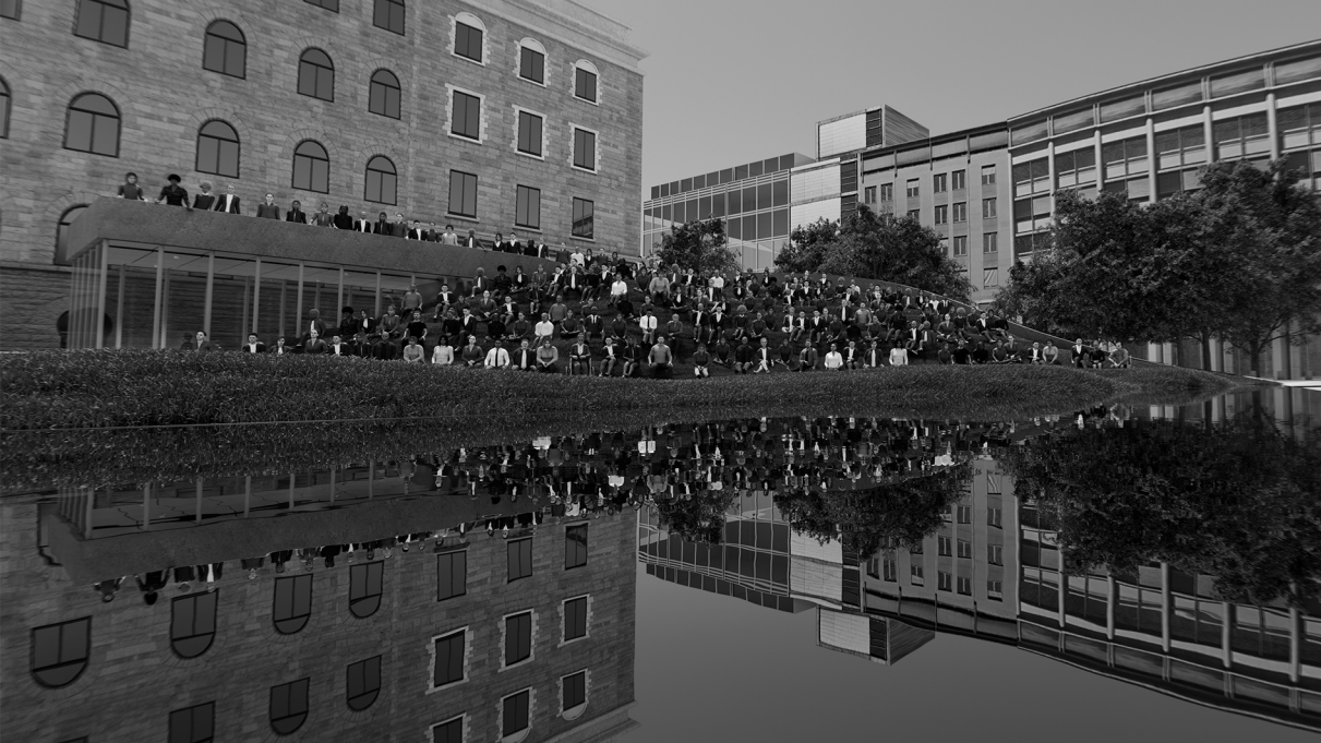
Illustrasjon som viser området over Folden som er avsatt til seremonier og arrangementer. Visualisering: Jad Nassour. ©Røstad + Khoury

Fold er ikke bare et sted for refleksjon. Det er også en scene for ritualer og meningsfulle tradisjoner. Én høytidelig dag i året, selve årsdagen for 22. juli, kommer minnesteedet til å bli et fristed for erindring, for å hedre livene som gikk tapt og motstandskraften til de som overlevde.