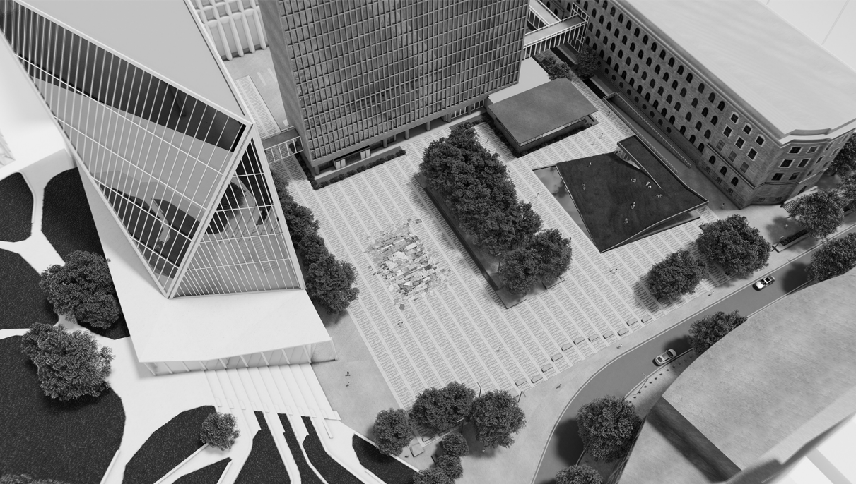
Illustrasjon av Fold sett ovenfra i det nye regjeringskvartalet. Visualisering: Jad Nassour. ©Røstad + Khoury