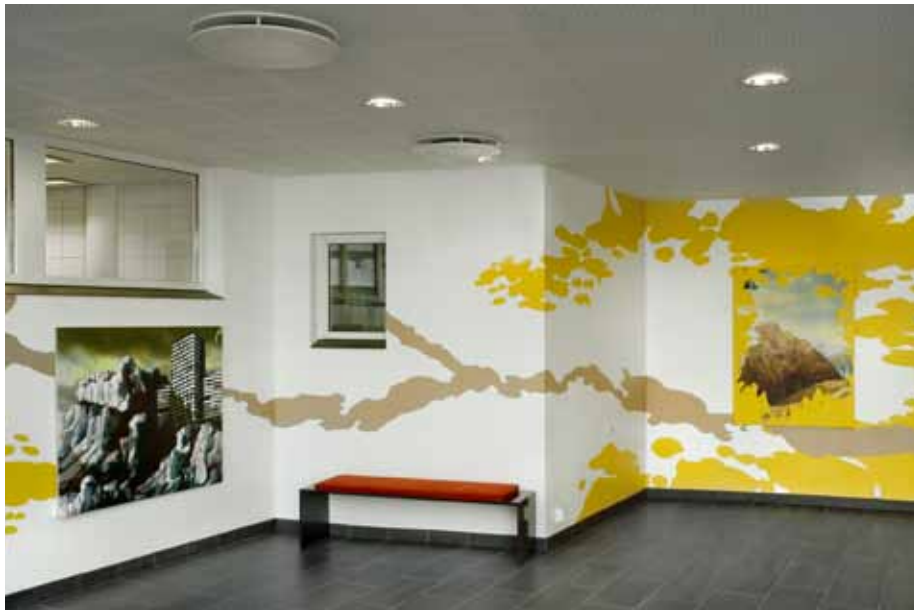
Tiril Schröder, veggmaleri/ veggtegnning, 2006. Høgskolen i Nesna. Foto: Jaro Hollan