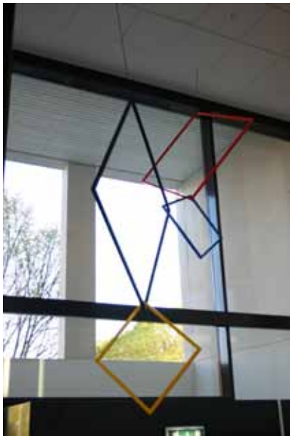
Camilla Løw, skulptur, 2008. Haugaland Tingrett. Foto: Camilla Løw