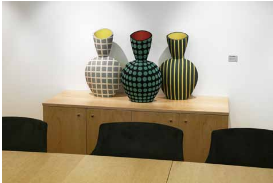
Bente von Krohg, keramikk, 2002. Regjeringskvartalet, S-blokken.