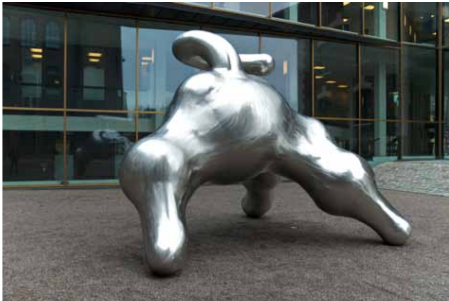
Per Inge Bjørlo, skulptur, 2007. Forsvarets ledelsesbygg Akershus.