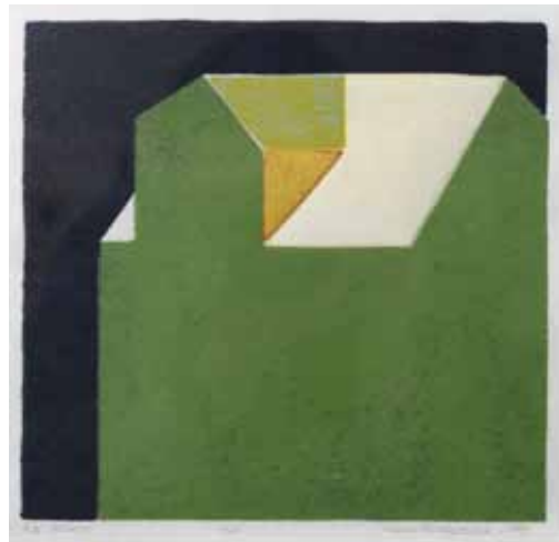
Hanne Borchgrevink, grafikk, 1999. Justisbygget i Kristiansand.