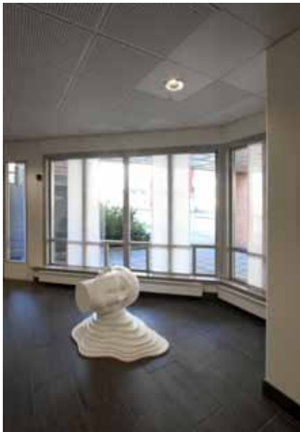
István Lisztes, skulptur, 2006. Aust-Agder Tingrett. Foto: Werner Zellen