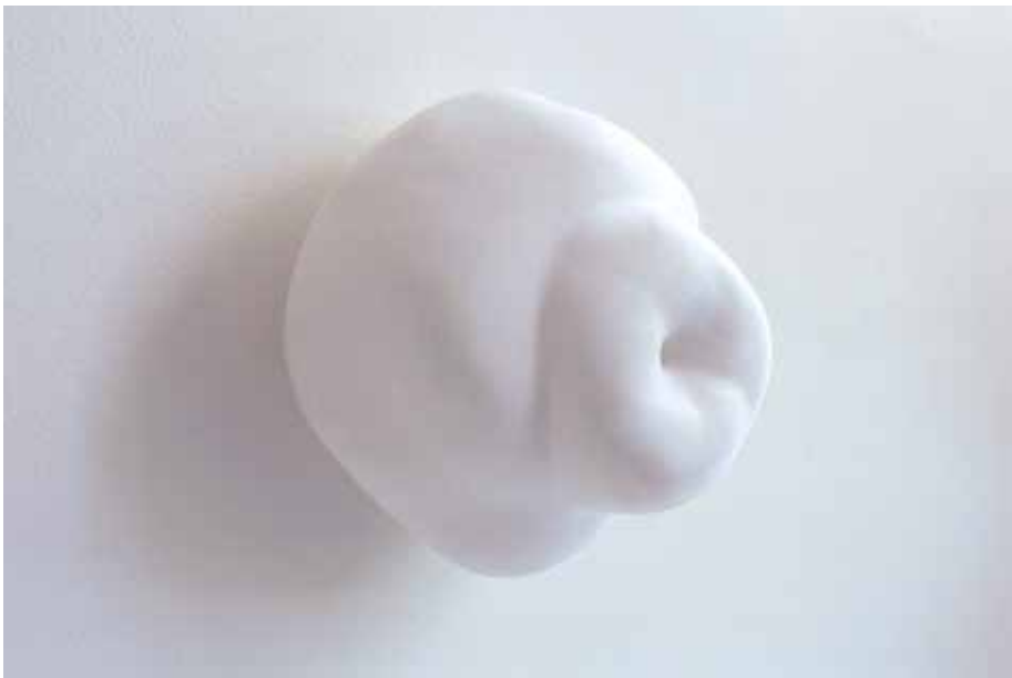
Martine Linge, skulptur, 2001. Universitet for miljø- og biovitenskap(UMB).