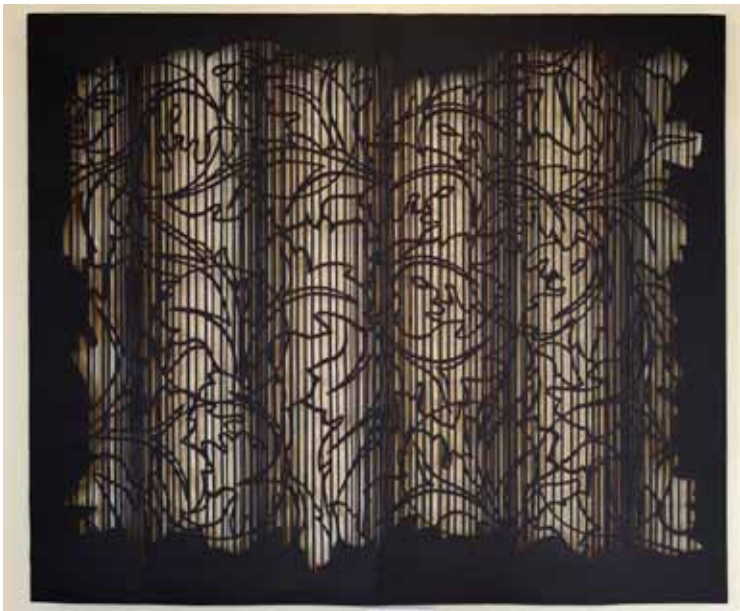
May Bente Aronsen, tekstil, 2008. Regjeringens representasjonsanlegg.