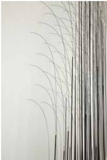
Tone Vigeland, skulptur, 2008. Regjeringens representasjonsanlegg.