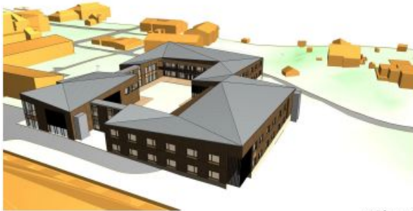
sett fra nord

Helse- og velferdssenteret er planlagt som en hageby, med en stor indre sanse-/atriumshage. Beboerrommene ligger i ytterkant av bygningskroppen med gode bokvaliteter, mens fellesareal vender inn mot atriumshagen.