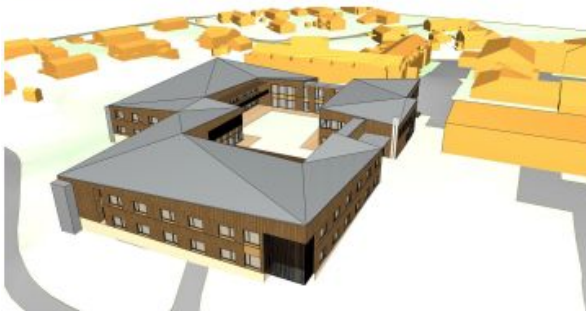
sett fra sør