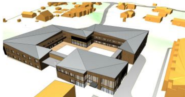
sett fra øst