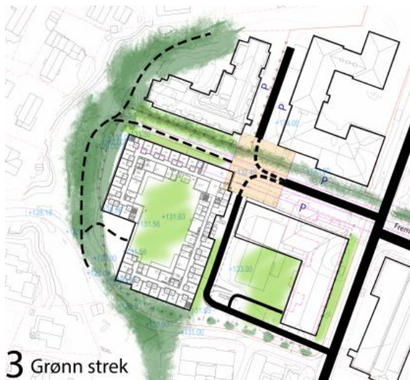
Figur 1: grønn strek

Det nye helse- og velferdssenteret skal bidra med gode kvaliteter til nærmiljøet.