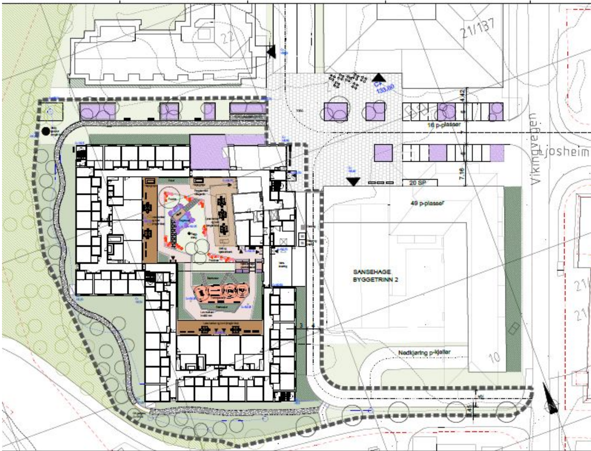
Figur 2: landskapsplan

Helse- og velferdssenteret er planlagt som en hageby, med en stor indre sanse-/atriumshage. Beboerrommene ligger i ytterkant av bygningskroppen med gode bokvaliteter, mens fellesareal vender inn mot atriumshagen.