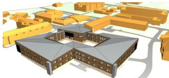
sett fra vest