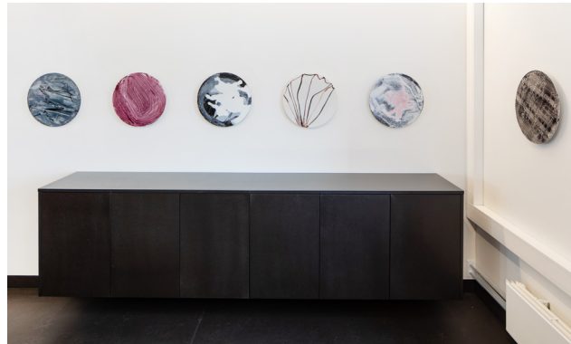
The Infinite 2018 (1), Olav Christopher Jenssen. Forside: Faded Remains (Narcissus, 2017) , Espen Gleditsch.

Besøksadresse: Universitetsvegen, Tromsø