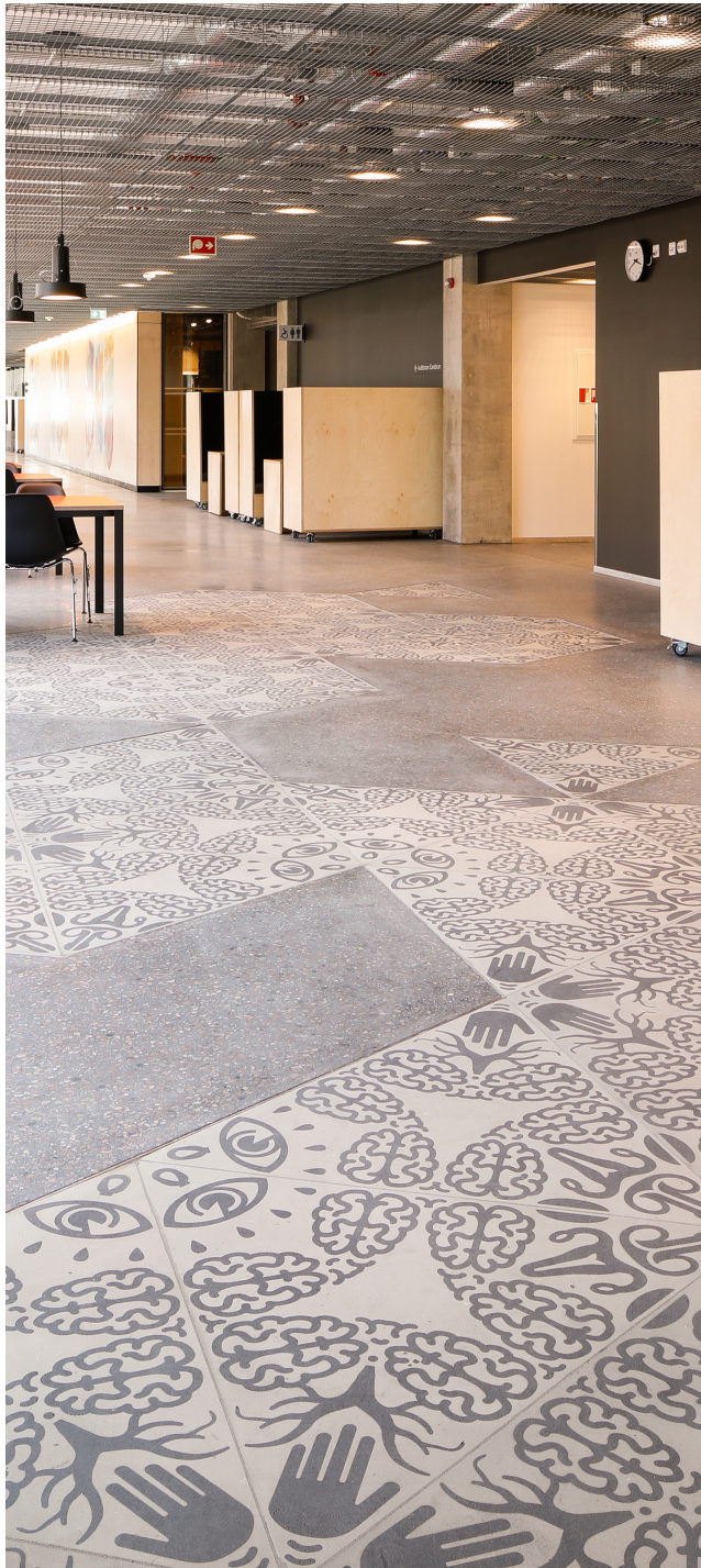
Crystal world , Gunilla Klingberg.