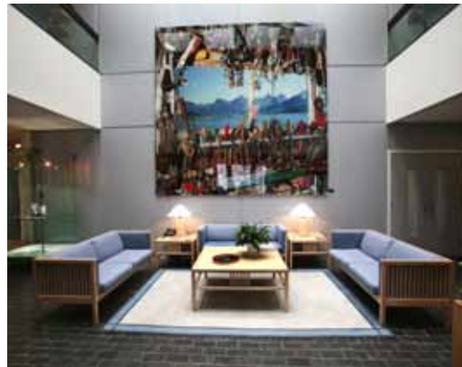
Rune Johansen, fotografi, 1996/2006. Den norske ambassaden i Washington D.C. Foto: Werner Zellien